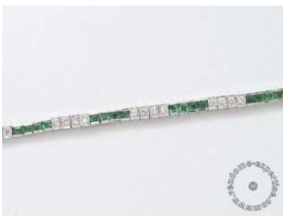
Lot :29 NV3165 Estimations :500 / 600 € Bracelet ligne en or gris, orné d'une ligne de diamants brillantés, alternés d'émeraudes calibrés. (égrisures) Poids brut: 19.20 g. Long: 18 cm.