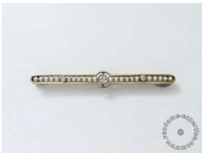
Lot :28 NV3082 Estimations :150 / 200 € Barrette en or, ornée de diamants taille ancienne, rehaussée de petites perles. Travail français vers 1910/20. (égrisures) Poids brut: 4.60 g. Long: 5.9 cm.