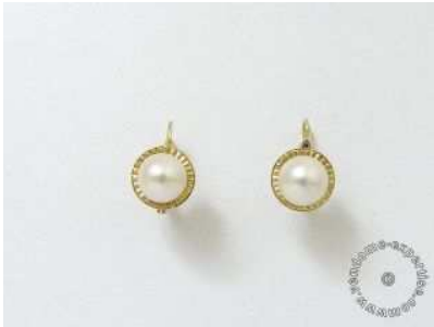
Lot :26 NV3080 Estimations :110 / 150 € Paire de boucles d'oreilles en or, ornées de perles de culture d'environ 7.5 mm. Poids brut: 4.40 g.