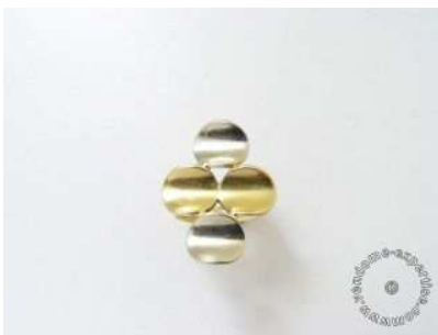
Lot :27 NV3090 Estimations :320 / 350 € Bague 2 tons d'or stylisant un trèfle à quatre feuilles. Porte l'inscription Chaumet 352 A . Poids brut: 7 g. TDD: 48.