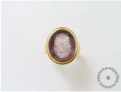
Lot :25 NV3081 Estimations :250 / 300 € Bague chevalière en or, ornée d'une intaille armoriée sur améthyste. (égrisures) Poids brut: 7.70 g. TDD: 49.5.