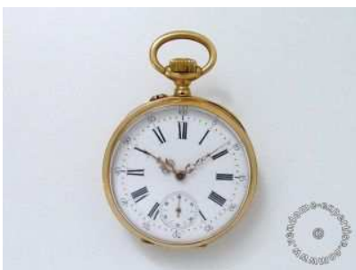
Lot :30 NV3212 Estimations :300 / 400 € Montre de poche en or, cadran émaillé blanc avec chiffres romains peints, trotteuse à 6 heures. Mouvement mécanique. Travail français de la fin du XIX e siècle début XX e . (en l'état) Poids brut: 76.50 g. Diam: 48 mm.